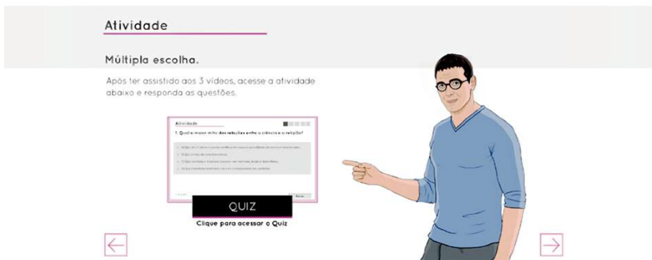
Figura 1 - Páginas da interface do módulo “Espiritualidade na prática clínica”