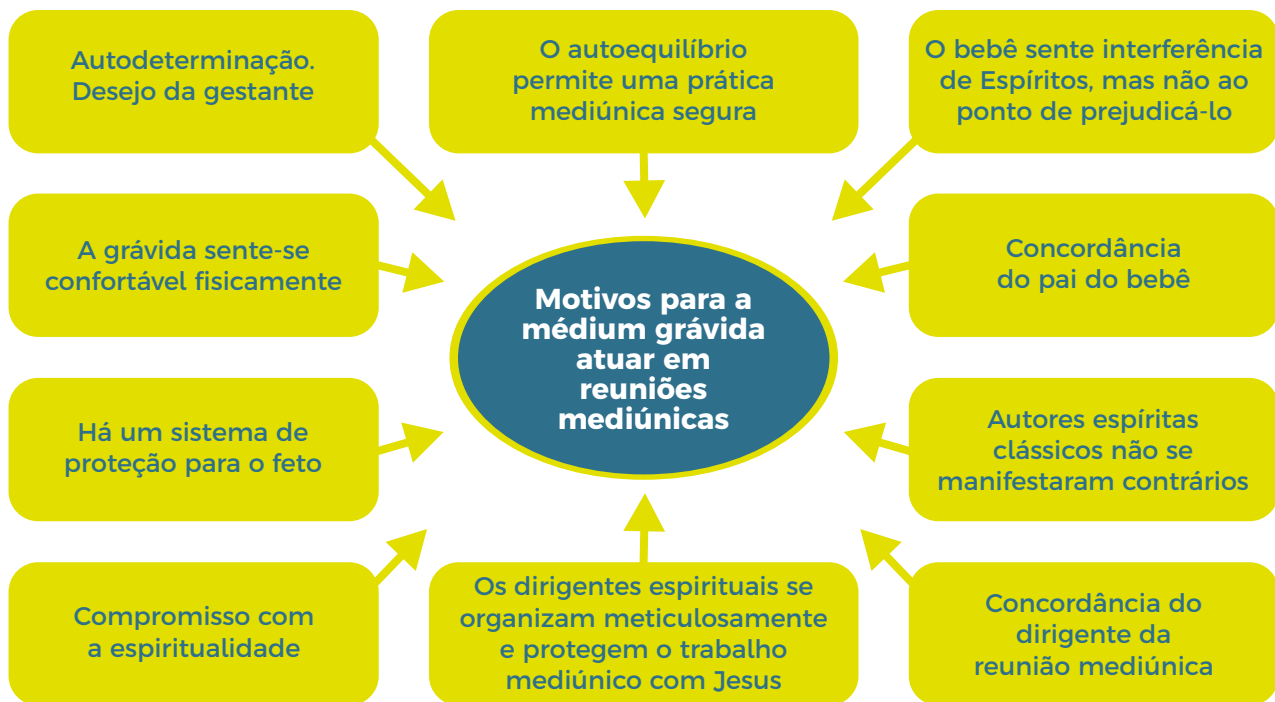
Figura 1 - Fatores convergentes para a prática mediúnica durante a gravidez